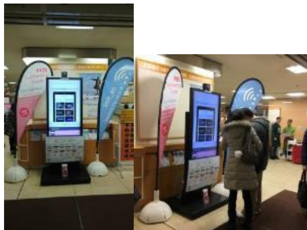
図 5 デジタルサイネージによる情報発信 (イメージ)