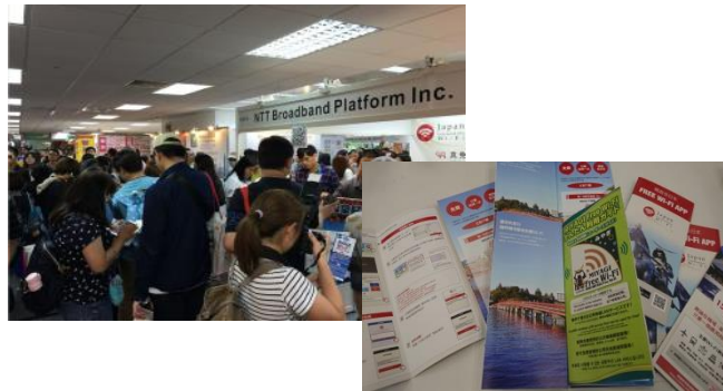
図 4 海外イベントでの情報発信 (イメージ)

海外で開催されるイベントに出展し、東北の観光情報を発信します。「台湾国際動漫節 2017」(2月2日～6日、台北)において、宮城県及び新潟市の観光情報や Free Wi-Fi サービス等について、パンフレット、ポスター等による情報発信を行います。