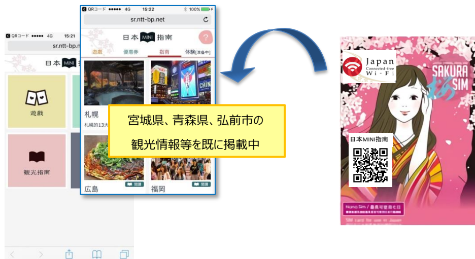
図3 繁体字 HP（イメージ）

情報発信をご希望の自治体様等は、本リリース末尾記載の問い合わせ先（NTTBP）までご連絡ください。（毎月 15 日ㄨ、翌月掲載）