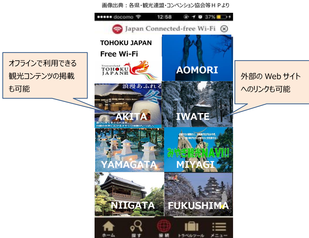
図 1 「TOHOKU JAPAN Free Wi-Fi」の画面（イメージ）