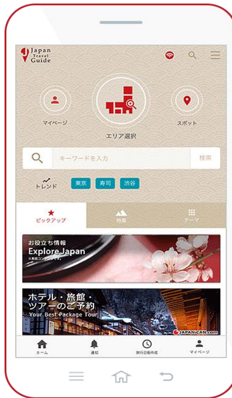
図2 「Japan Travel Guide」の画面（イメージ）

(※) 「Japan Travel Guide」の詳細は、以下の URL をご参照ください。